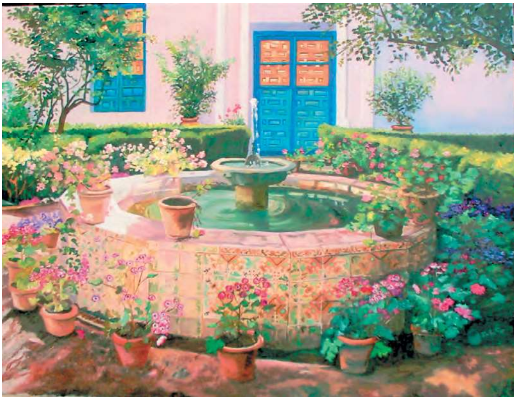
PATIO DE LA MADAMA 81x65