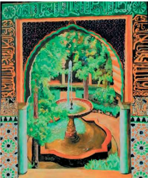
PATIO DE LOS CIPRESSES 65x81