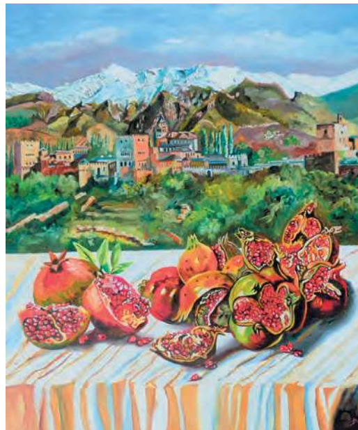
ALHAMBRA Y GRANADAS 60 x 75