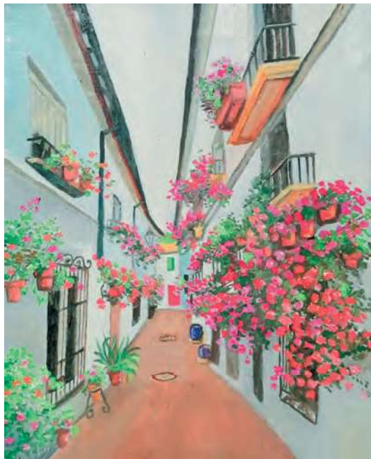
BARRIO DE LA VILLA 38x55