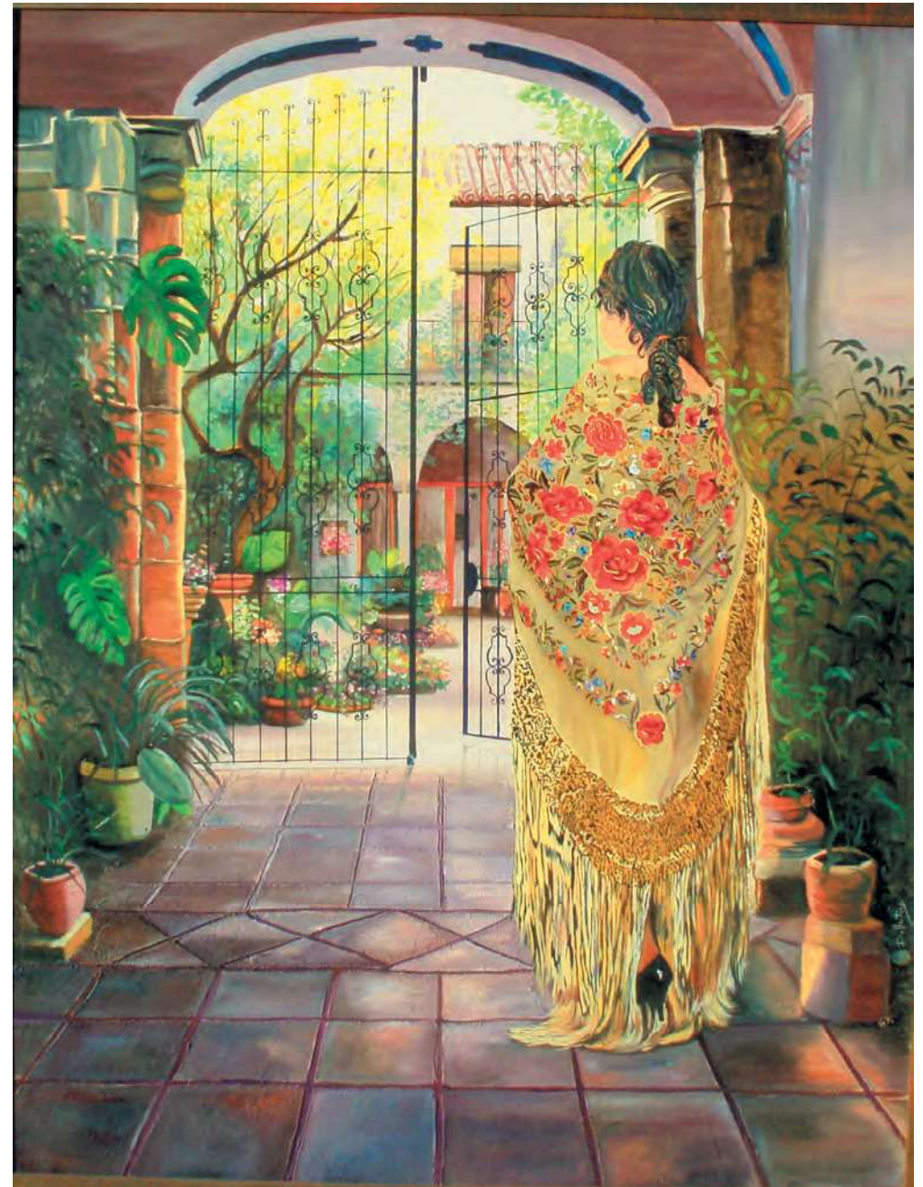
PATIO CON REJA 114 x 146